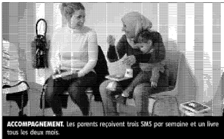
ACCOMPAGNEMENT. Les parents reçoivent trois SMS par semaine et un livre tous les deux mois.

Depuis octobre, 317 familles d'Orléans et Montargis participent à une innovante méthode d'éveil langagier, destinée aux enfants de 18 à 24 mois. Les parents bénéficient de conseils de professionnels de la petite enfance, par téléphone, et lors d'ateliers pour favoriser la découverte du langage.